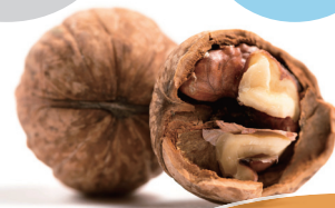
くるみバター入りクッキー