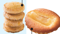
くるみオイル使用のりんごケーキ